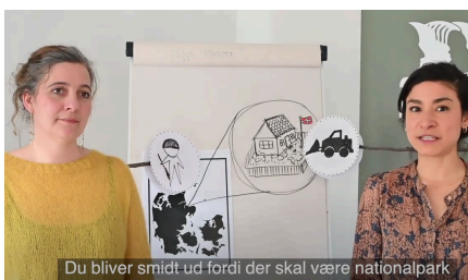
IWGIA, projektvalg 2021