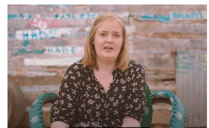
Dreamtown, projektvalg 2023